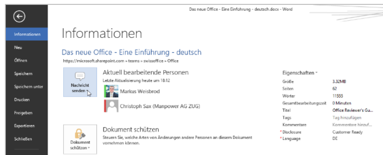
Verwenden Sie Lync in Ihren Office Applikationen, um schneller und einfacher zu kommunizieren.

Um an einer Lync-Besprechung teilzunehmen, brauchen Sie auf Ihrem PC oder mobilen Endgerät nur einen Befehl per Maus oder Touch auszuführen.